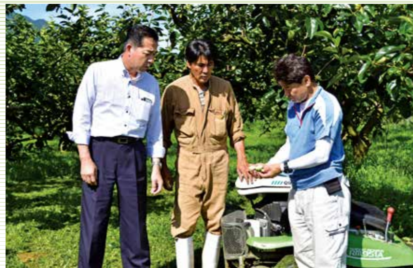
柿やネクタリンなどを栽培している果樹生産者と意見交換 (平成30年7月9日、福岡県で)