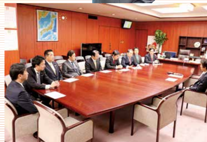
水田農業振興議員連盟メンバーで、齋藤健農林水産大臣に申入れ (平成29年12月7日)