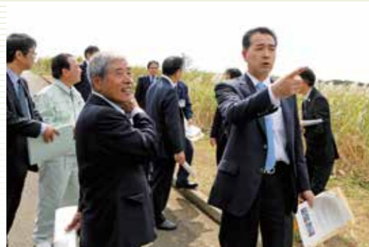
サトウキビの低糖度対策や、台風の被害状況などを 鹿児島県、沖縄県でヒアリング (平成30年2月24日)