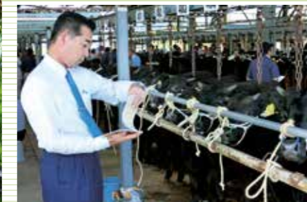
畜産現場の状況把握のため、 家畜市場で子牛のせり市を視察 (平成29年10月13日、宮崎県で)