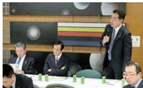
「地域の農林水産業の振興促進議員連盟」の会議で、 農政のあり方について発言 (平成30年4月23日)