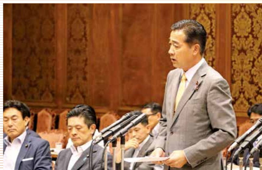
参議院内閣委員会・農林水産委員会連合審査会で、 党を代表して「TPP関連法案の改正」について質疑 (平成30年6月19日)