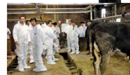
自民党「畜産・酪農対策委員会」で、 経営実態把握のために酪農生産者を視察 (平成29年11月19日、北海道で)