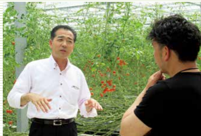
ミニトマトを大規模栽培している生産者と意見交換 (平成30年7月8日、熊本県で)