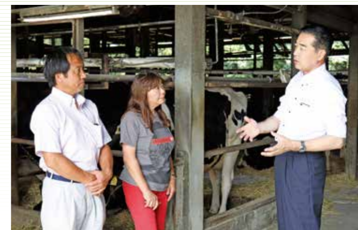
TPP等に対して不安を抱えている 酪農生産者と意見交換 (平成30年7月26日、千葉県で)