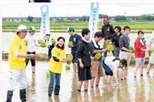
自民党国会議員が田植えから収穫まで行う 「米作りプロジェクト」に事務局次長として夫婦で参加 (平成30年6月16日、埼玉県久喜市で)