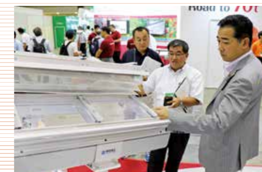
東京ビックサイトで開催された施設園芸・植物工場展で、 温室設備や園芸用機器などの最新技術を視察 (平成30年7月12日、東京都で)