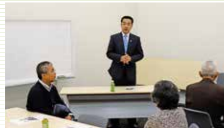
参議院議員会館で、JAかみましき組合員の 皆さんに国政報告 (平成29年11月16日)