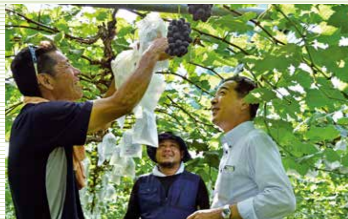
土作りから徹底的にこだわっているブドウ生産者を視察 (平成30年7月9日、福岡県で)